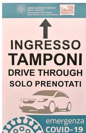
Segnaletica "Drive Through"